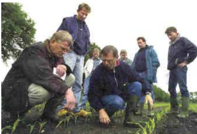
Omschakelen kan je niet alleen: samenwerking tussen boeren en andere relevante actoren is essentieel in het omschakelingsproces