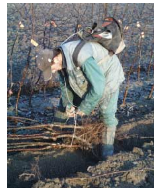
Rugklachten kunnen ontstaan als gevolg van bukwerkzaamheden