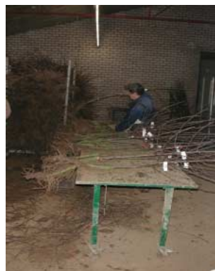
Binnen vruchtbomen sorteren op tafels

In de praktijk wordt het rooien en sorteren van vruchtbomen op verschillende manieren uitgevoerd, zowel buiten op het veld als binnen in de schuur of een combinatie hiervan. Uit onderzoek blijkt dat personeel het sorteren in de schuur als zwaarder ervaart dan sorteren op het veld, ondanks de aangenamere omstandigheden in de schuur. Oorzaak is het vele kort-cyclische werk bij sorteren in de schuur. Sorteerkwerk kent een hoge mate van herhaling, met veel draaibewegingen, regelmatig bukken en heffen en strekken van de armen. Een nieuwe methode is het direct opvoeren van de gerooide bomen naar een aan de plukbandrooier gekoppelde sorteerkwagen. Op deze wagen worden de bomen gesorteerd en gebundeld. Bij deze werkmethode is de fysieke belasting van de werkenden veel geringer. Ze hoeven niet meer gebukt en door zware grond te lopen. Bovendien treedt minder kwaliteitsverlies op aan het product