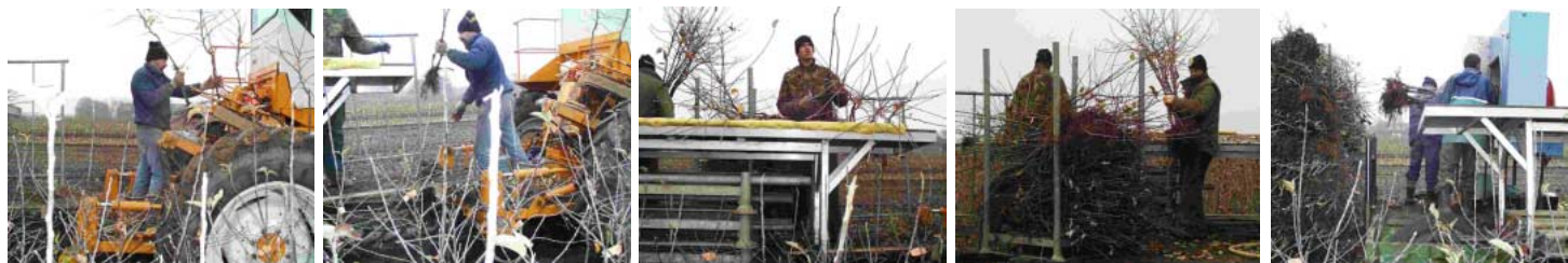
Figuur: Rooien en aansluitend op gekoppelde wagen sorteren