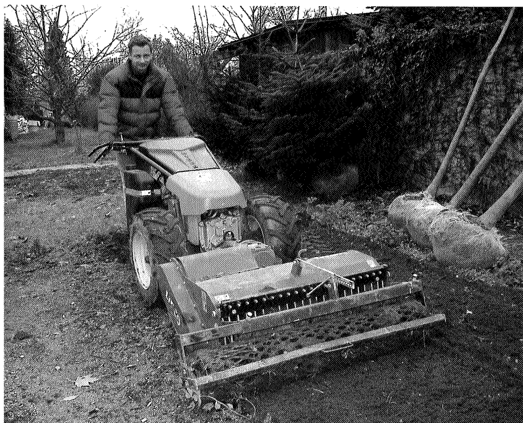
Werken met een eenasser wordt met de huidige machines een probleem volgens de nieuwe EU-richtlijn Trillingen. Je zou er nog geen uur per dag mee mogen werken.

Er zijn twee richtingen waarin maatregelen mogelijk zijn. Zorgen voor minder trillingen of de werktijd aanpassen door bijvoorbeeld te rouleren. Bij trekker rijden valt te denken aan nieuw dempend materieel of het aanpassen van bestaand materieel, bijvoorbeeld via een geveerde trekkerstoel die bovendien goed is ingesteld. De rijsnelheid is een andere grote invloedsfactor: hoe hoger de snelheid, des te meer trillingen. Dit geldt vooral op een ongelijke ondergrond. Ook rijgedrag kan veel invloed hebben; bij kuilen in de weg vaart minderen of eromheen sturen is veel beter voor de rug dan er dwars doorheen gaan. ■